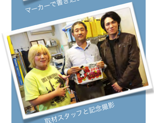
取材スタッフと記念撮影