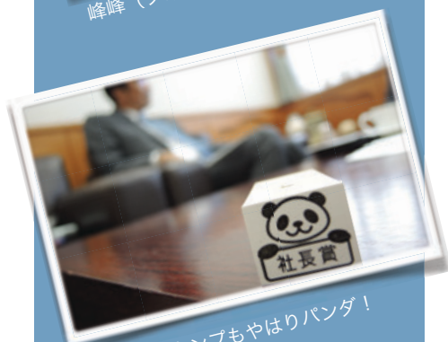
社長賞のスタンプもやはりパンダ！