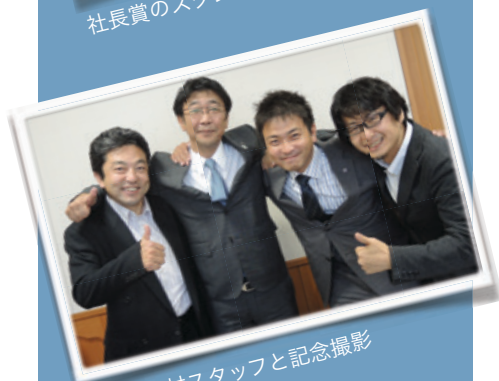
取材スタッフと記念撮影