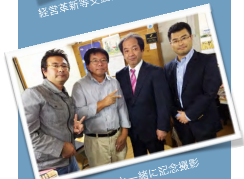
取材スタッフと一緒に記念撮影