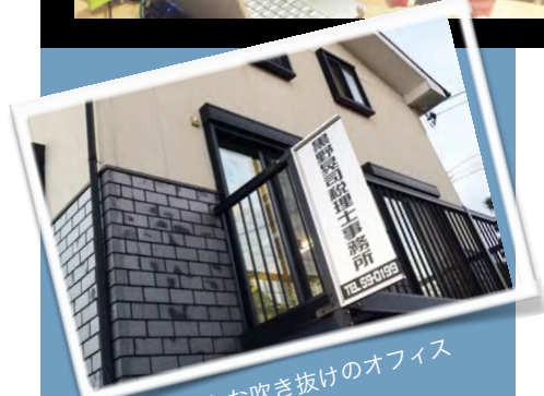
中はステキな吹き抜けのオフィス

最後に、多くの青年部の仲間とともに過ごした貴重な時間は、とても充実していたので、青年部で得た経験を今後の人生に生かしていきたいと笑顔で締めくくっていただきました。我々後輩たちもこの取材を通じて青年部の良さを再認識でき、今後の青年部活動に生かしていきたいと改めて思った取材となりました。