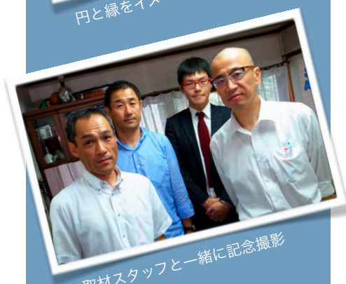
取材スタッフと一緒に記念撮影