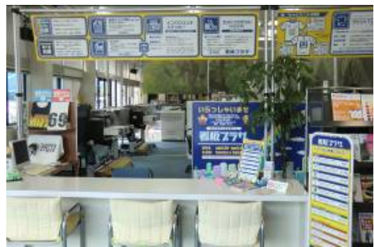
広くて綺麗な店舗、商談も気持ちよさそう