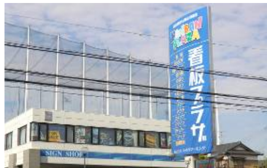
さすが!!印象に残る看板です