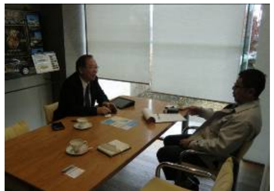
なるほどなお話たくさん聞けました